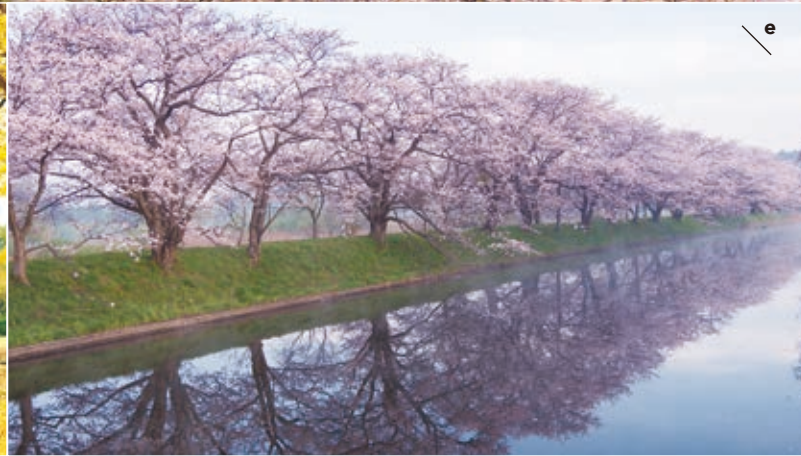
a. 여름에는 초록색, 가을에는 새빨갭게 언덕을 물들이는 코키아(땃사리)/국영 히타치 해변공원 [히타치나카시] b. 세계최대의 청동 대불상 / 우시쿠 대불 [우시쿠시] c. 눈부신 노란색의 은행나무 가로수길 / 이바라키현 역사관 [미토시] d. 약 100여종의 매화를 볼 수 있는 / 가이라쿠엔 [미토시] e. 1.8km 에 다다른 벚나무 길 / 후쿠오카제키 [쓰쿠바미라이시]