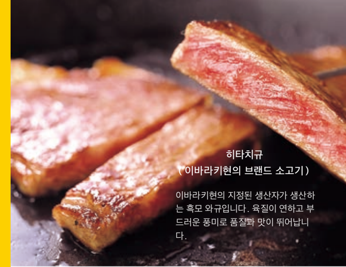
히타치규 (이바라키현의 브랜드 소고기)

이바라키현은 농업과 수산업이 발달한 곳입니다. 신선한 야채와 우수한 품질의 육류 그리고 수산자원이 풍부하여 다양한 일식 문화를 즐길 수 있습니다.