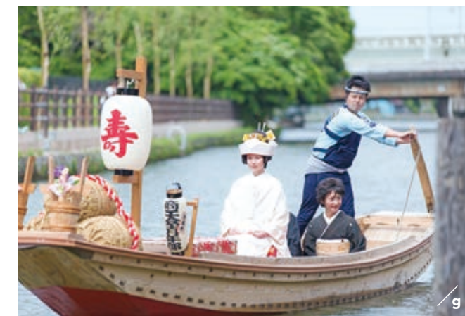
a. 가미이소노 도리이/이소사키 신사 [오아라이정] b. 일본의 근대미술에 큰 영향을 미친 오카쿠라 덴신이 설계한 건물/록가쿠도 [기타이바라키시] c. 에도 시대의 종합대학/고도칸 [미토시] d. 본전/가시마 신궁 [가시마시] e. 미소기노 가미고토/기온 축제 [가시마시] f. 등나무 꽃은 5월 초순이 절정/가사마 이나리 신사 [가사마시] g. 6월에는 이타코의 전통적인 혼례와 만개한 붓꽃을 보실 수 있습니다/스이고 이타코 붓꽃 축제 [이타코시]