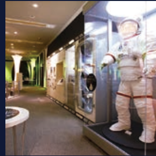
쓰쿠바 엑스포 센터

세계최초의 웨어러블 사이보그 HAL 등 첨단 기술에 가까워질 기회를 방문자에게 제공합니다.