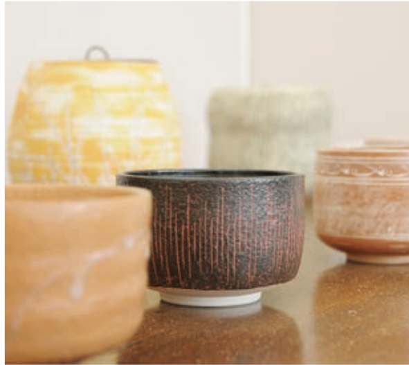
가사마 야키 (도예)

투명도가 높고 윤기가 나는 양질의 다이고 산 옷을 사용합니다. 칠기 (옷칠한 그릇)는 세대를 넘어 사용할 수 있는 그릇입니다.