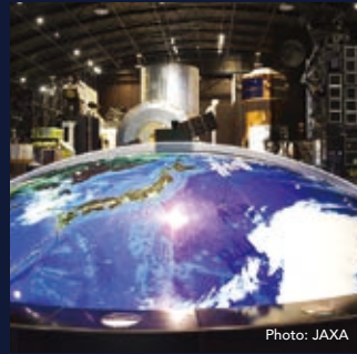
JAXA 쓰쿠바 우주센터

늘어난 공장과 정박한 배 등이 연출하는 SF적인 야경을 바다 위에서 감상하실 수 있습니다.