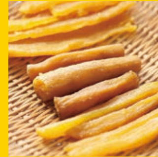
말린 고구마 (고구마 말랭이)

히타치야키 소바는 이바라키현의 재래종으로 전국의 소바 전문점에서 사랑받고 있습니다.