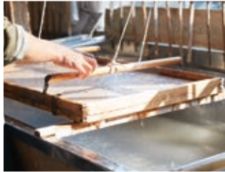
니시노우치 화지 (和紙)

히타치오타시의 닥나무만을 사용하여 만든 내구성과 보존성이 뛰어난 화지 (和紙)입니다.